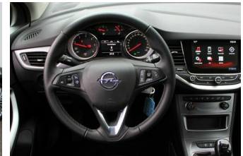
Roßnagel Automobile GmbH