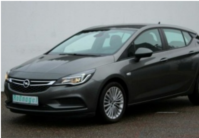
Roßnagel Automobile GmbH