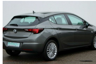
Roßnagel Automobile GmbH