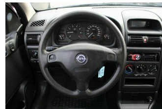
Roßnagel Automobile GmbH