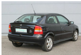
Roßnagel Automobile GmbH