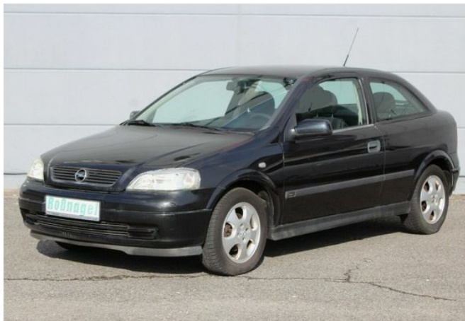
Roßnagel Automobile GmbH