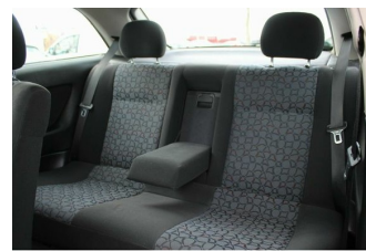
Roßnagel Automobile GmbH