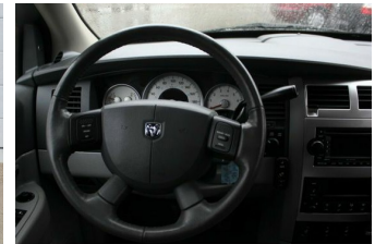
Roßnagel Automobile GmbH