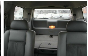
Roßnagel Automobile GmbH