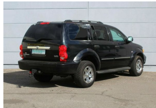
Roßnagel Automobile GmbH