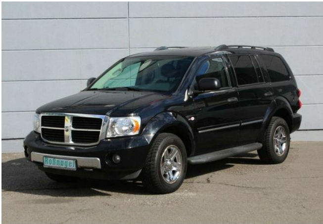
Roßnagel Automobile GmbH